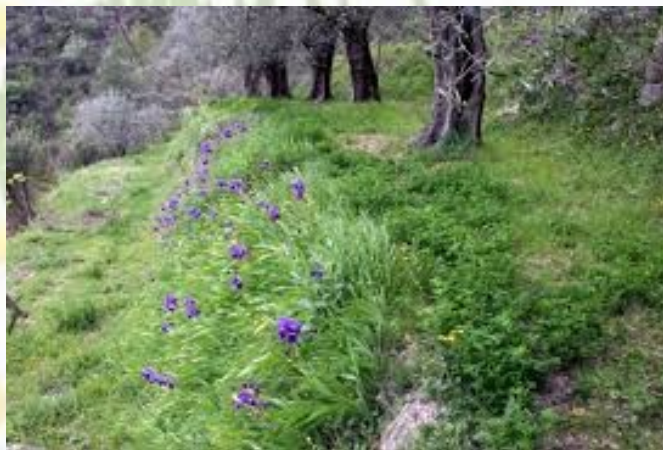
Des iris pour tenir les talus

On a constaté que les températures dans l'environnement des couvre-sols sont souvent plus élevées de 8° par rapport celles des gazons.