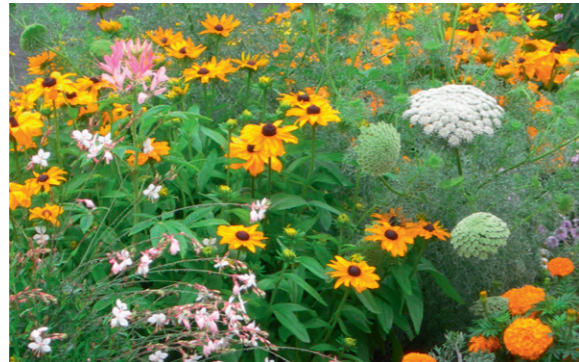
Vernou - Rose d'Inde 'Sumo Orange', Ammi visnaga , Rudbeckia sullivantii 'Goldsturm', Cleome spinosa , Gaura lindheimeri