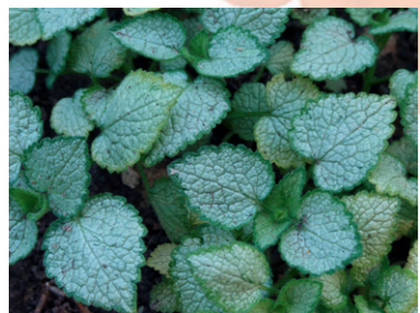
Lamium maculatum 'White Nancy'

(Les Cahiers du Fleurissement - avril 2013)