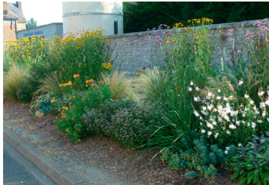
Neuillé-Pont-Pierre - Physostegia virginiana 'alba', Euphorbia myrsinites , Rudbeckia laciniata , Origanum laevigatum , stipa tenuifolia , Verbena bonariensis