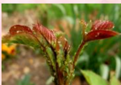
Coccinelle et sa larve

- Les pucerons verts, noirs, cendré : insectes piqueurs sucres. Les coccinelles, syrphes et chrysopes vous aideront à les combattre.