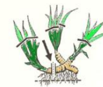
Manière de diviser une touffe d'iris et de préparer le feuillage des fragments.